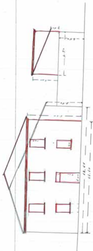
Prospetto verso la traversa di Via Berti e via della fiera