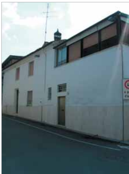
Via Vittorio Veneto 31 Fronte Principale