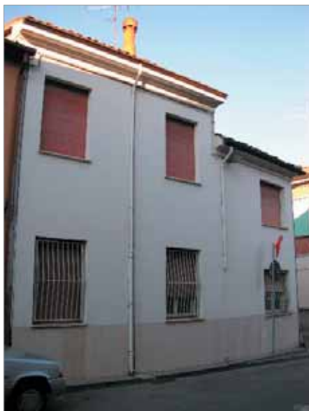
Via Berti Fronte Laterale